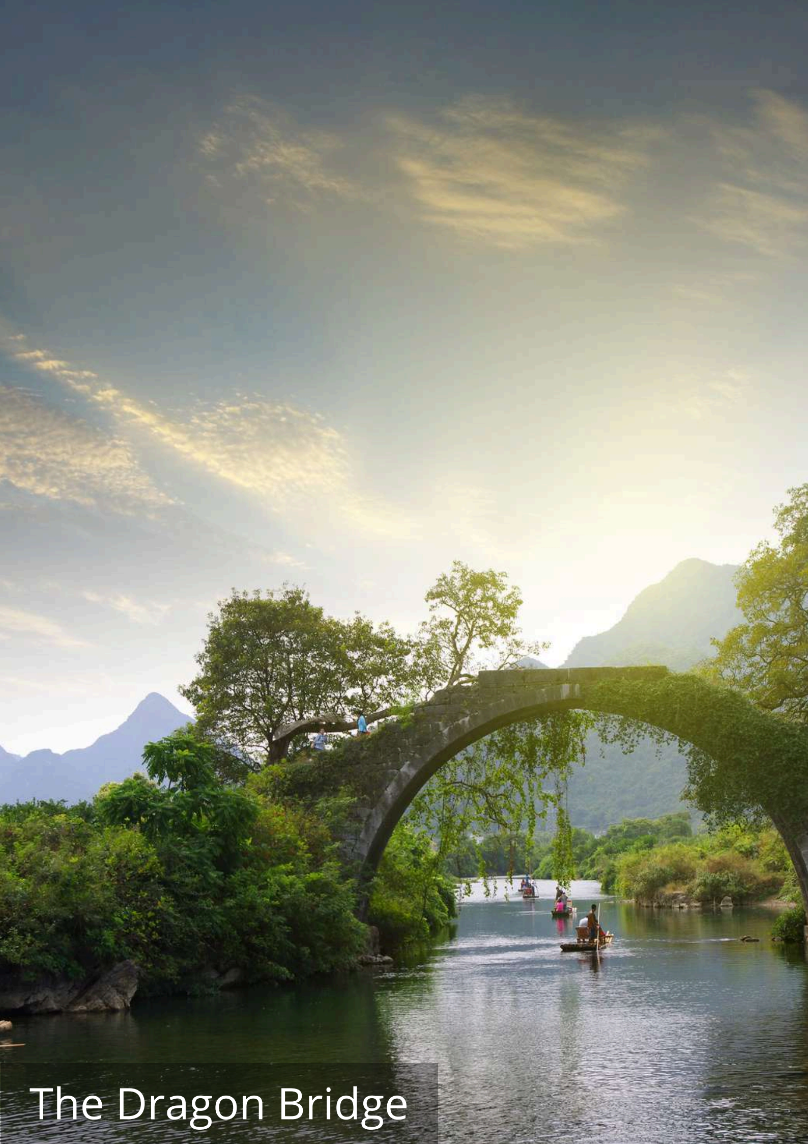
The Dragon Bridge