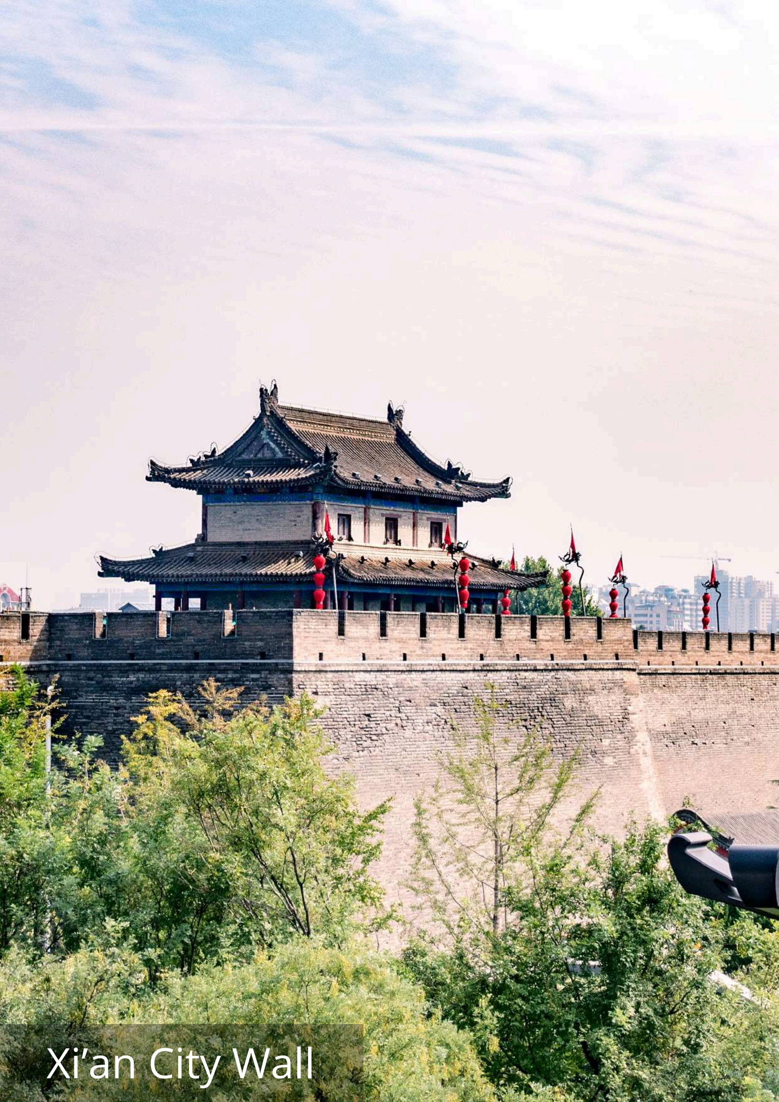
Xi'an City Wall