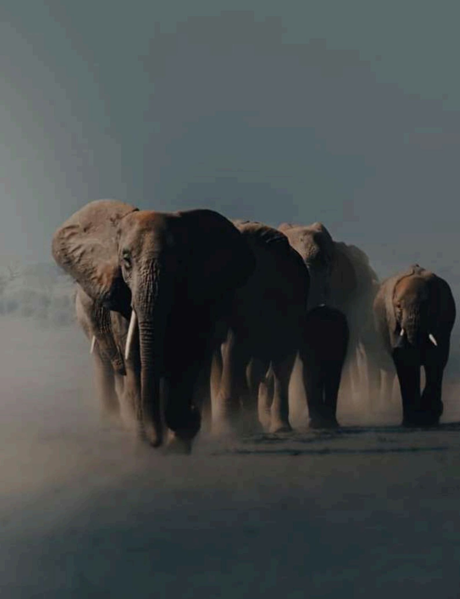
Elefanti Del Deserto