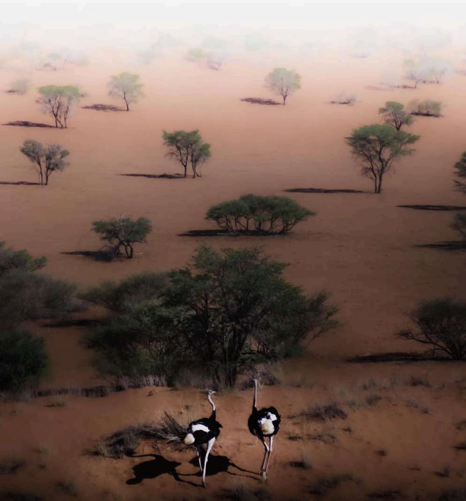
Abitanti del deserto