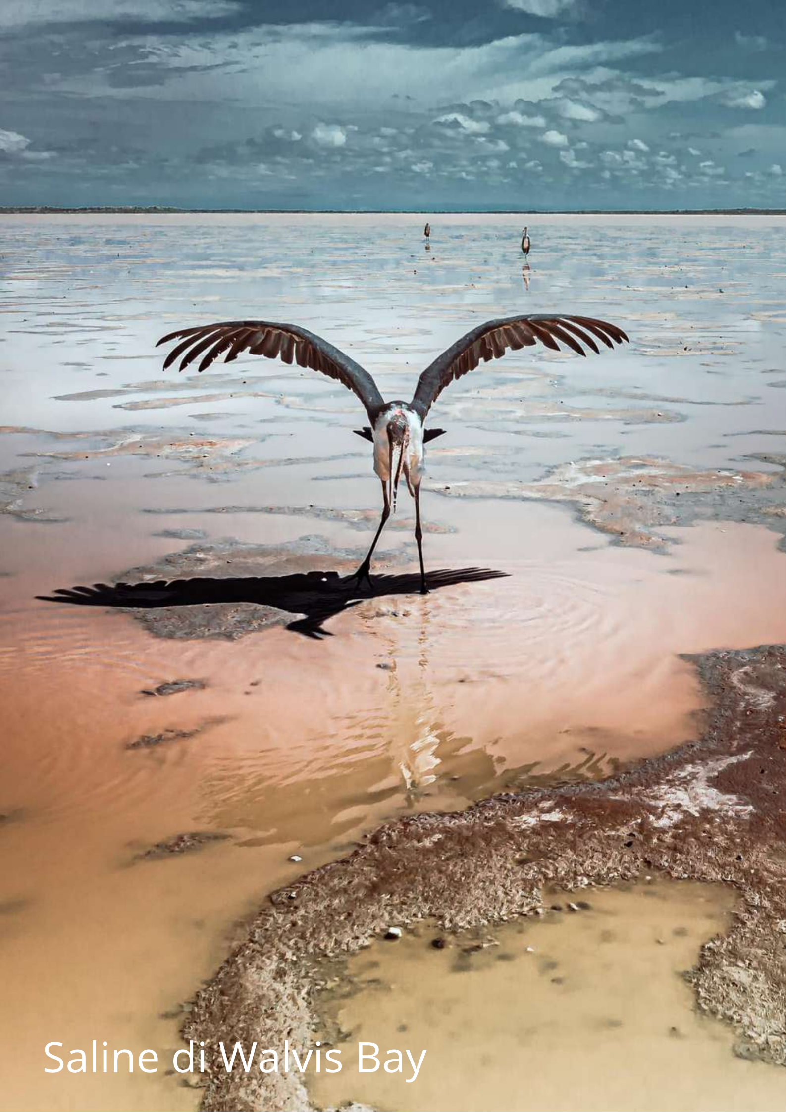
Saline di Walvis Bay