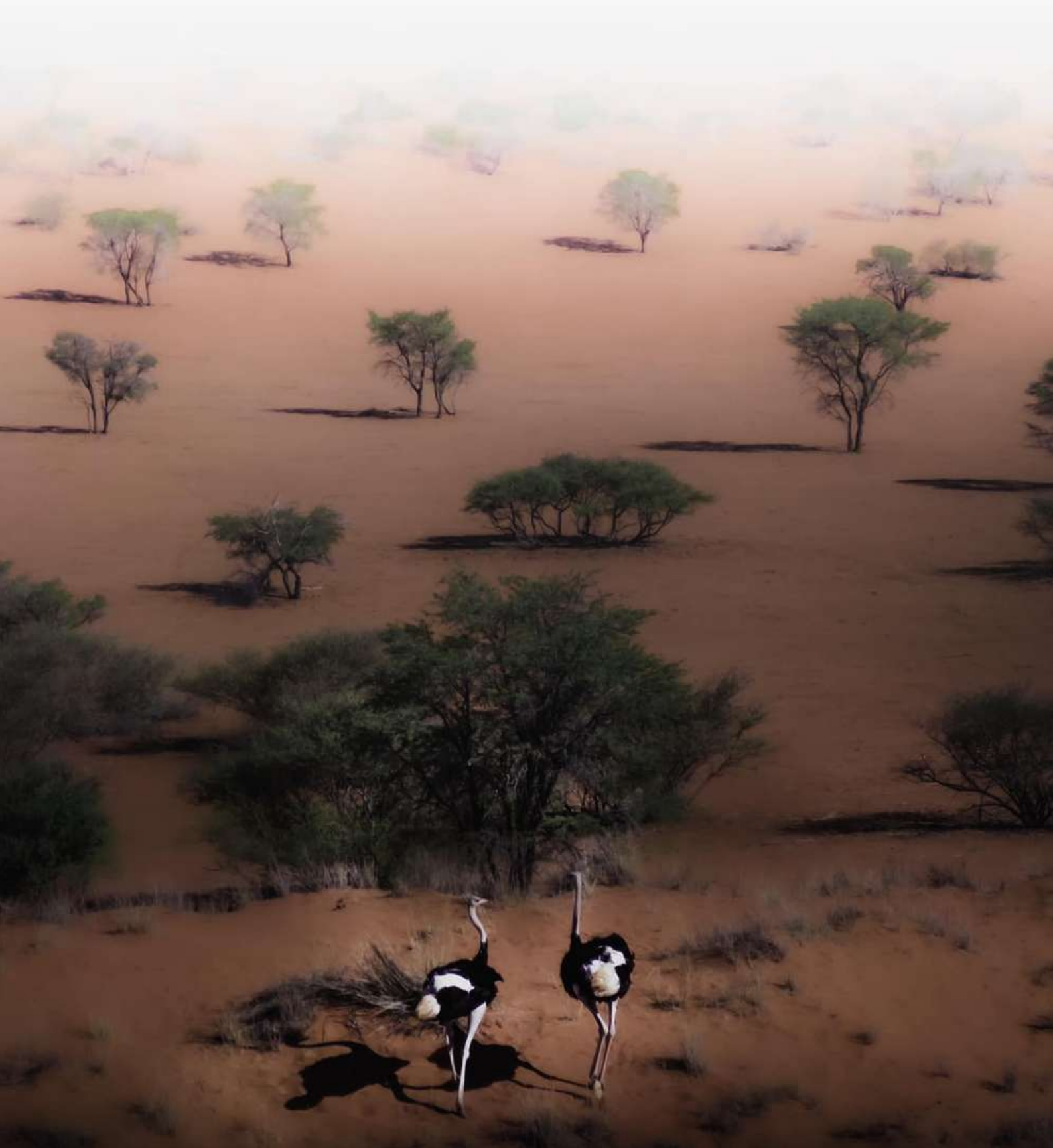
Abitanti del deserto